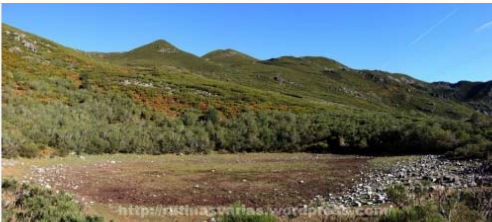
Charca Grande a los pies de Pico de las Charcas (1.800 m.) y Cuerno Maldito (1.858 m.)

Enseguida llegamos a una laguna-charca más grande que como es finales del verano está seca.