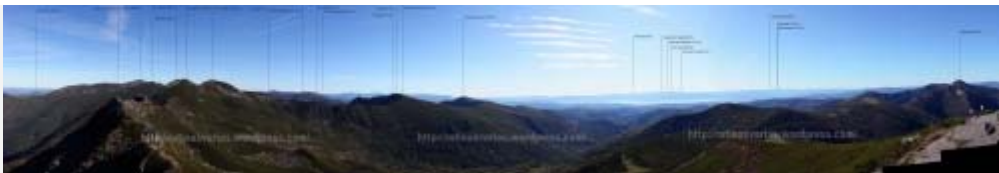
Panorámica desde Tres Obispos. Pinchad en la foto, merece la pena.

Desde la cuerda no son más de 10 minutos hasta la cima. Allí veremos el cartel del pico Tres Bispos puesto en terreno gallego, pero no en la misma cima. El panorama desde allí es magnífico.