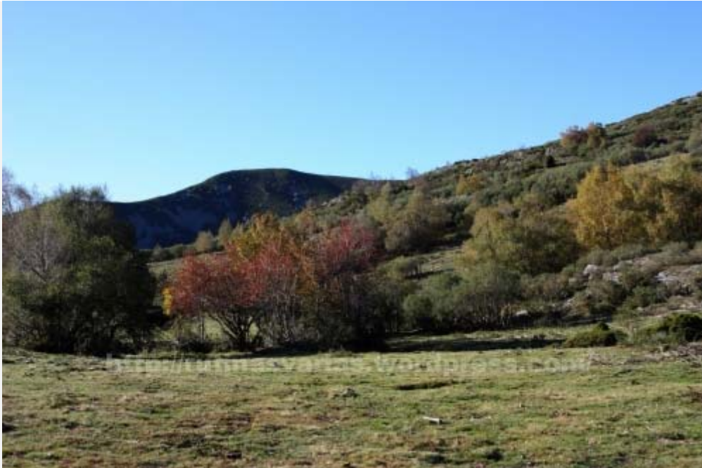
Paraje de Las Charcas, a los pies de la parte leonesa de Tres Obispos

Además se encuentra flanqueado por los picos de Campo Longo, Cuerno Maldito, Las Charcas y Os Penedois además del objetivo del día: el Pico Tres Obispos, con una altitud de 1.795 metros.