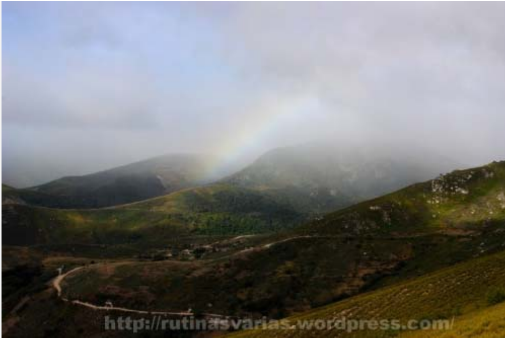
Campo del Agua (en otra ocasión que fui)

Al tema. Partimos desde Campo del Agua , que es una de las brañas de Aira da Pedra. Actualmente no es lo que era antes. Antes era una braña llena de pallozas con los techos (techos) de centeno. Ahora poco queda de aquella imagen de los años 80 que un incendio se llevó. Después se puso cubierta de pizarra acabando con el aspecto de pueblo celta tipo "aldea de Asterix" que tenía. Si pincháis aquí podéis ver una foto de como era antes.