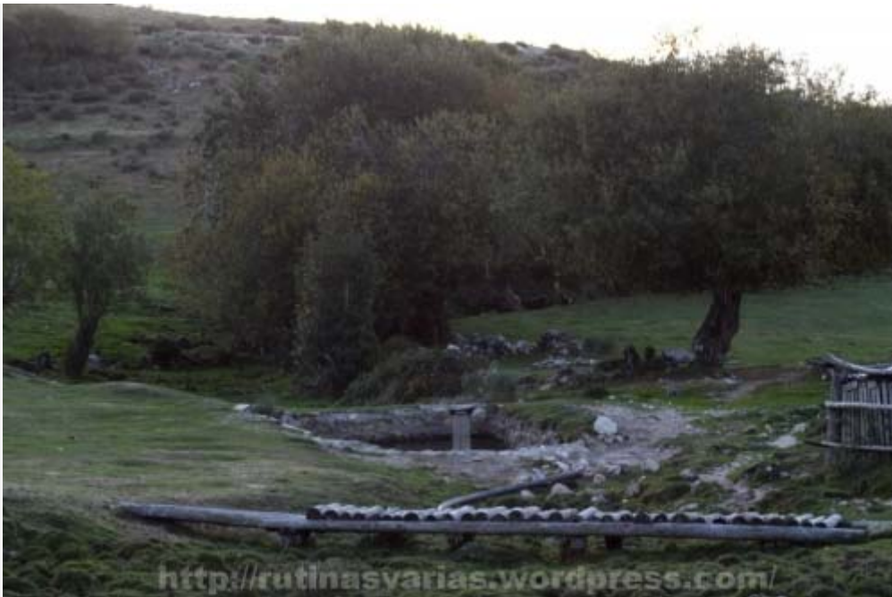
Campo del Agua

El lugar es extraordinario. Su entorno es más que privilegiado y cuenta con una riqueza en fauna y flora que pocos lugares de la Península Ibérica los tendrán. Una vez allí tomaremos el camino que cruza el pueblo que es la continuación de la pista por la que hemos venido. Caminaremos aproximadamente durante 2,2 kms (según el SigPac) bordeando la Veigadolmo que es una zona de prados, hasta llegar a un punto donde sale un camino a la derecha que se interna dentro de un bosque. Dicho bosque es una maravilla, disfrutaremos de un agradable trayecto contemplando sus árboles de gran tamaño y oyendo correr el río Porcarizas. El nombre de dicho bosque según los mapas es Camporredondo y más arriba se le denomina Caborca de Suastallas.