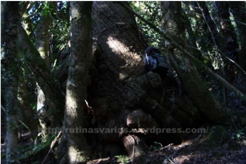
Gran tronco de tejo rodeado de acebos bastante grandes

Tras llegar a la Fuente Bendita comienza un tramo más pronunciado de subida que nos llevará al refugio de Las Charcas. Hasta aquí habremos tardado alrededor de una hora. Yo me entretuve mucho, por eso no os fiéis tampoco de este dato ya que a cada paso que daba más disfrutaba de lo que me rodeaba. Sería capaz de estar sentado en ese bosque un día entero sin moverme, tan solo escuchando, viendo, meditando.