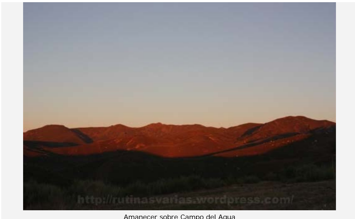
Amanecer sobre Campo del Agua

Hoy nos vamos a Tres Obispos. Es un pico situado en el límite de las provincias de Lugo y León. Aunque la cima está por pocos metros en las provincia de León.