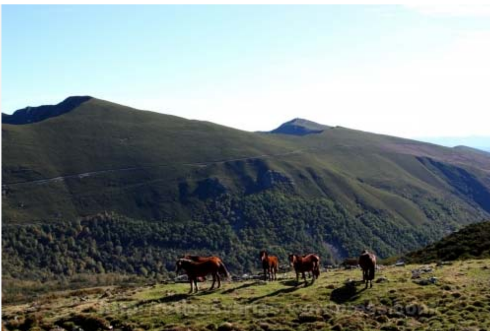
Prado subiendo a Tres Obispos. Al fondo Pico de Campo Longo (1.794 m.) y Alto de Vedral (1.750 m.)

Desde la laguna hasta Tres Obispos el camino no está marcado pero más o menos puede irse deduciendo. Nuestro punto de referencia debe ser la cuerda sur de la montaña. Atravesaremos zonas de prados donde pasta el ganado dirigiéndonos al collado sur.