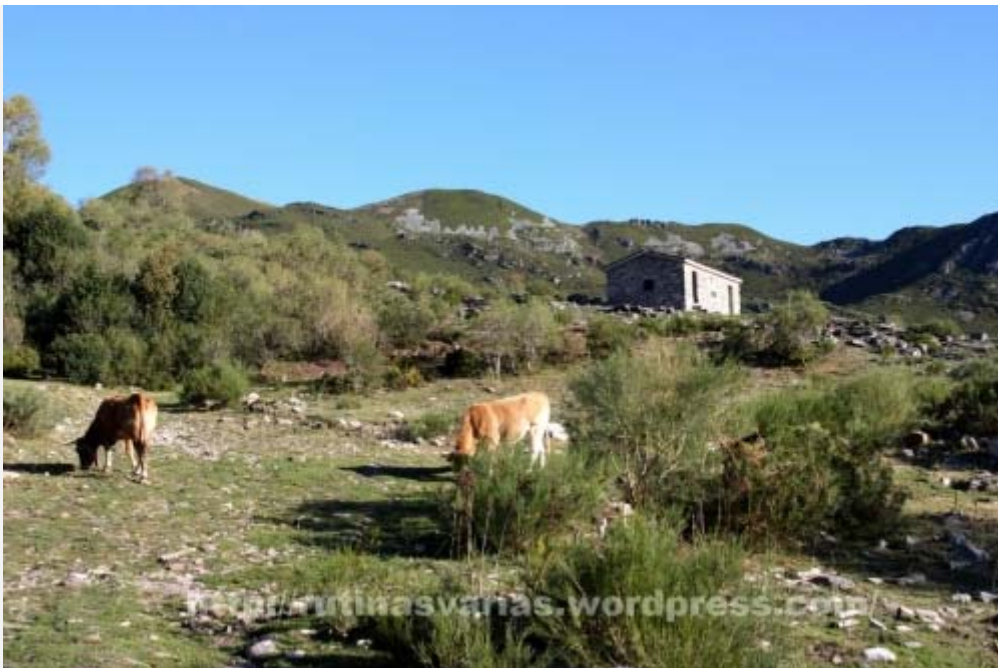
Refugio de las Charcas

Tras llegar a la Fuente Bendita comienza un tramo más pronunciado de subida que nos llevará al refugio de Las Charcas. Hasta aquí habremos tardado alrededor de una hora. Yo me entretuve mucho, por eso no os fiéis tampoco de este dato ya que a cada paso que daba más disfrutaba de lo que me rodeaba. Sería capaz de estar sentado en ese bosque un día entero sin moverme, tan solo escuchando, viendo, meditando.