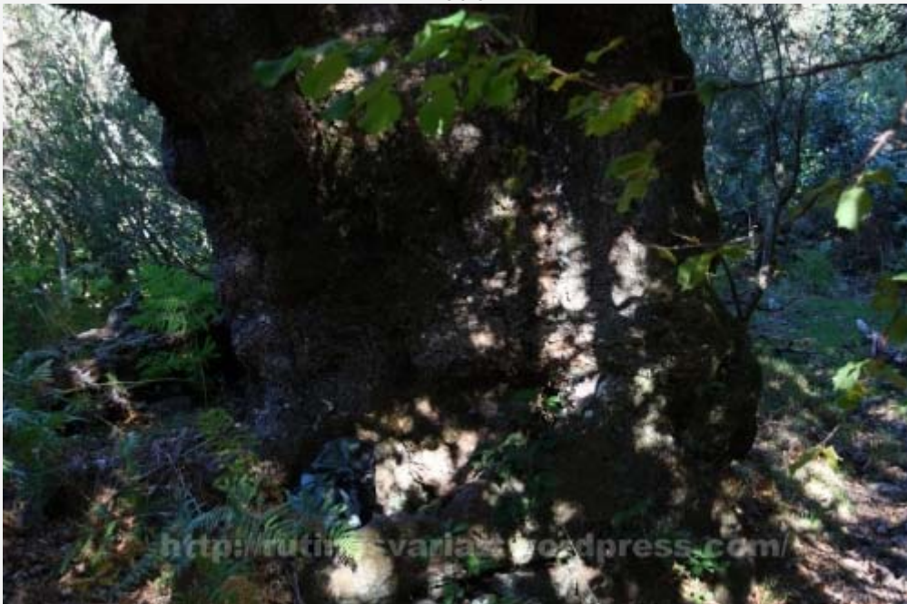
El roble. Comparadlo con mi mochila

Además hay acebos, abedules, capudres, y tejos. Fijaos en esta foto. Se ve el gigantesco tronco de un tejo, ya muerto (¡qué pérdida!), rodeado por varios acebos. Apreciad el tamaño comparado con mi mochila.