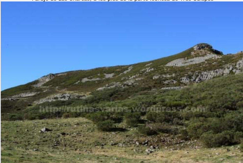
Tres Obispos (1.795 m.)

Tres Obispos no es el más alto de los picos de Ancares. Más bien es el más pequeño de los grandes. Pero subir hasta arriba no defraudará.