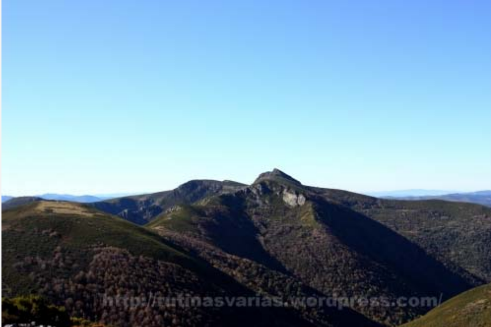
Peñarrubia (1.822 m.) desde Tres Obispos

El caso es que a pesar de tratarse de montañas de baja estatura el ambiente de montaña que hay por allí es muy bueno, y sorprende debido a la poca altitud de las montañas.