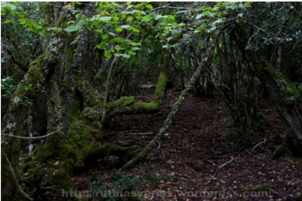
Bosque subiendo a Tres Obispos

El lugar es extraordinario. Su entorno es más que privilegiado y cuenta con una riqueza en fauna y flora que pocos lugares de la Península Ibérica los tendrán. Una vez allí tomaremos el camino que cruza el pueblo que es la continuación de la pista por la que hemos venido. Caminaremos aproximadamente durante 2,2 kms (según el SigPac) bordeando la Veigadolmo que es una zona de prados, hasta llegar a un punto donde sale un camino a la derecha que se interna dentro de un bosque. Dicho bosque es una maravilla, disfrutaremos de un agradable trayecto contemplando sus árboles de gran tamaño y oyendo correr el río Porcarizas. El nombre de dicho bosque según los mapas es Camporredondo y más arriba se le denomina Caborca de Suastallas.