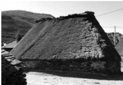
Palloza bien conservada en el pueblo de Balouta